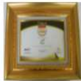
Warta Ekonomi Best Financial Performance 2018