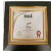
Infobank Insurance Awards Best Financial Performance 2018