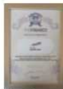
The Finance Top 20 Financial Institution 2019