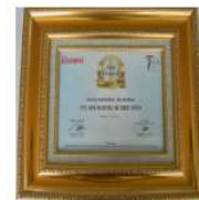
Media Asuransi Insurance Awards Best General Insurance 2021