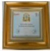
Media Asuransi Insurance Awards Best General Insurance 2018