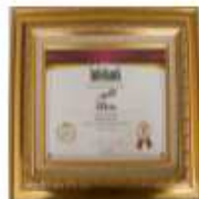
Infobank Insurance Awards Best Financial Performance 2019